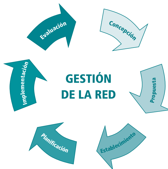
Figura 1: Modelo de gestión de una red formal

Junto con el modelo de fases y de los procesos que ocurren en estas fases, es necesario construir una caja de herramientas que se pueda aplicar dentro de cada fase. Los resultados esperados no se podrán lograr si no se cuenta con las herramientas apropiadas y las respectivas competencias para aplicarlas. Por lo tanto, la gestión de redes será más eficiente mientras mayor sea el nivel de profesionalización.